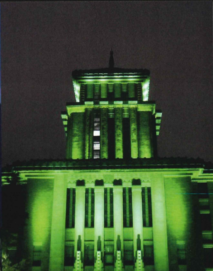
神奈川県庁 5月29日（金）から6月4日（木）