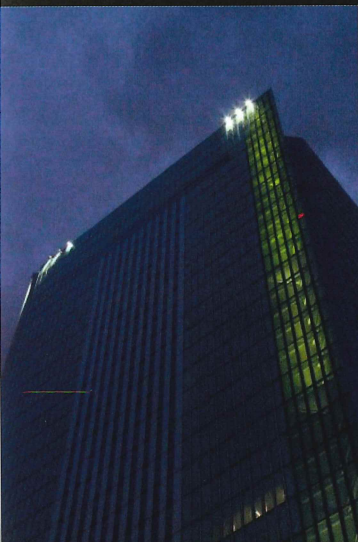
横浜市庁舎 5月31日（日）～6月6日（土）